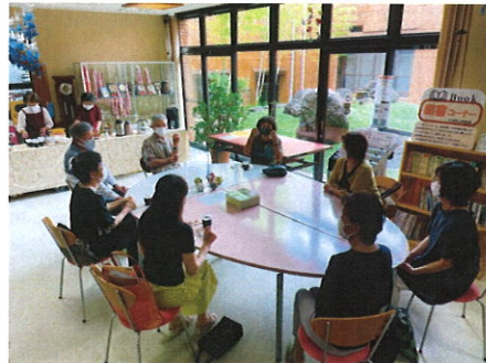
サロン活動の推進