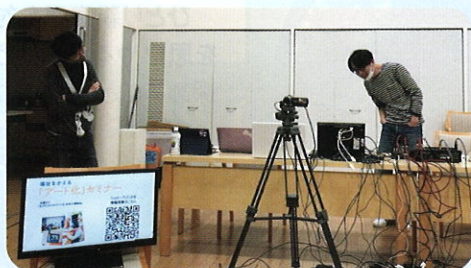
一般社団法人たんぽぽの家 (奈良市)

子育て応援として、コロナ感染への不安で外出を控えている子どもたちに、感染対策をしながら、デイキャンプや芋ほり等のイベントを毎月実施しました。子どもたちは笑顔や元気を取り戻しました。