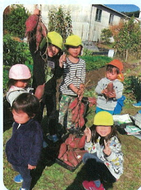
子どもの森2021 (斑鳩町)

安心して、子ども食堂を開催できるよう、アルコールディスペンサー等の衛生備品を購入しました。 夏祭りやクリスマス会も開催できました。