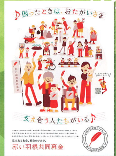
令和4年度共同募金運動ポスター