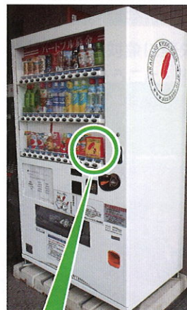
奈良県社会福祉総合センター