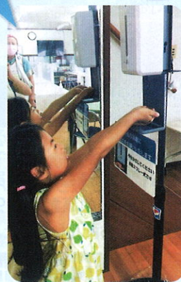
安堵こども食堂 (安堵町)

障害のある人のアート活動を支えるためのオンラインセミナーを開催しました。コロナ下で多様な人たちが地域でつながることが難しい中、配信という手法でより広く創作の環境づくりやサポートの仕方を普及することができました。