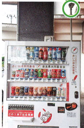
五條市社会福祉協議会