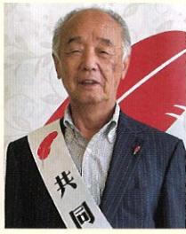
社会福祉法人 奈良県共同募金会 会長