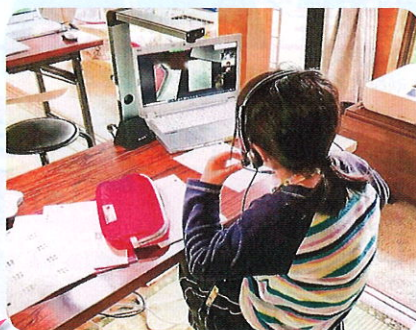
特定非営利活動法人 せいじゅんたすけあいこども食堂 (大和郡山市)

コロナ下で孤立し、精神的にも経済的にも悩み困っている学生が増えています。皆様の善意の寄付に支えられ、約1,800名の学生に食料を支援することができました。