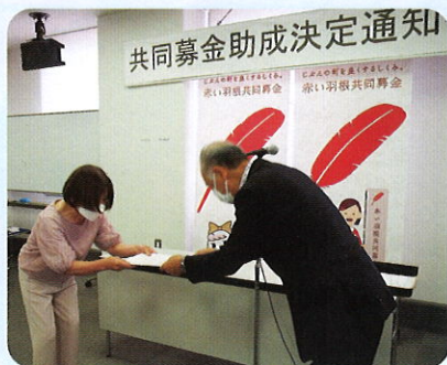
6月28日 助成決定通知書交付式

今年度も、新型コロナ感染下の食支援や学習支援、生きづらさを抱える人の居場所づくりや相談支援など、民間によるきめ細かな活動を支援する「新型コロナ感染下の福祉活動支援助成」の事業を公募し、22団体に対し、合計12,202,131円の助成を決定しました。