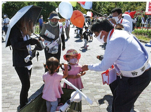
馬見丘陵公園での募金活動