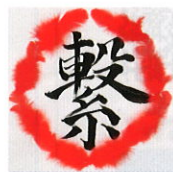
「ありがとうメッセージ」DVD

「赤い羽根の新聞を書きました。歴史やどんなことに使われているかを全校に配布しました。新聞を書いたことにより、田原本町の役に立ててうれしかったです。」(田原本町立東小学校 生徒のみなさん)