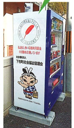
下市町交流センター