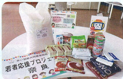
奈良県生活協同組合連合会 (奈良市)

新型コロナウイルスの影響が長期化する中、令和2年度に引き続き、全国の共同募金会とともに、新型コロナ感染下の福祉活動を応援するため、民間の食支援や学習支援、居場所を失った人などへの相談支援活動等に対して助成を行いました。